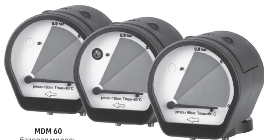
MDM 60 базовая модель